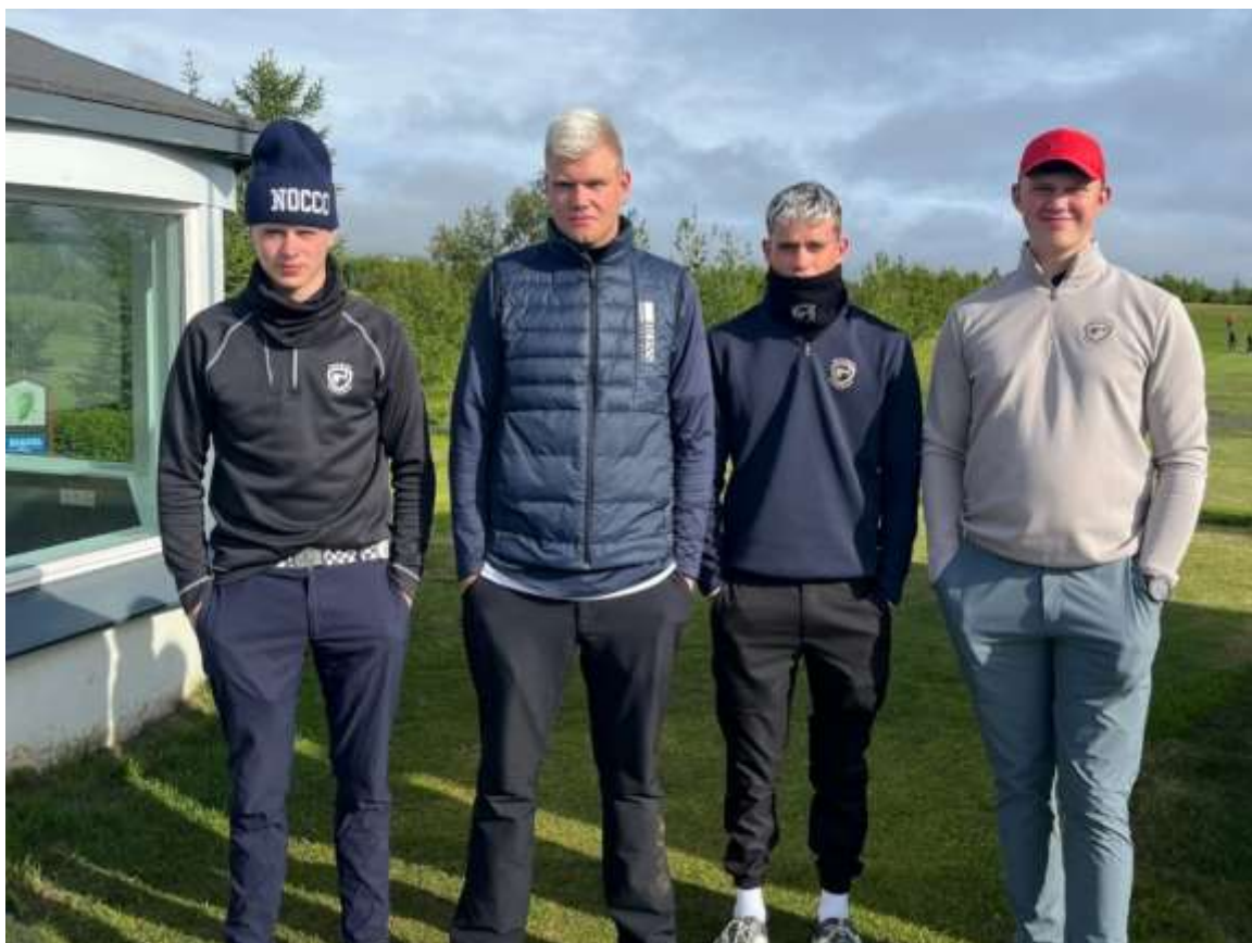
Drengjasveit GM U18 | 7. sæti í Íslandsmóti golfklúbba 2024