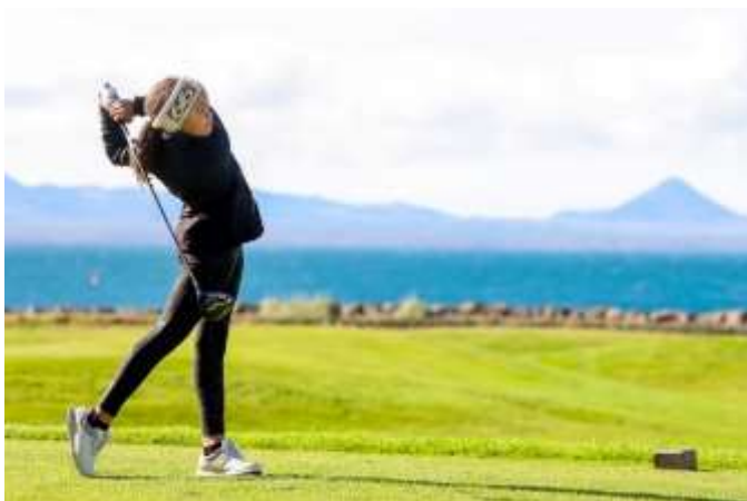
12 ára og yngri kk