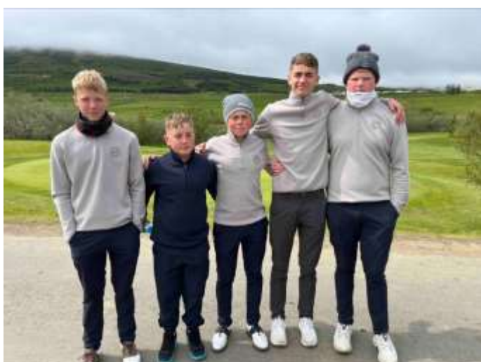
Drengjasveit GM U16 | 4. sæti í Íslandsmóti golfklúbba 2024