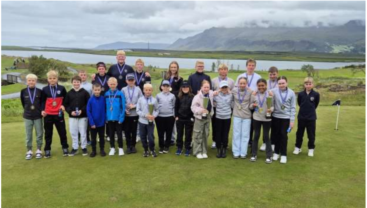
Verðlaunaafhending í meistaramóti barna og unglunga 2024

Meistaramót barna og unglunga fór fram dagana 30. júní. - 2. júlí. Iðkendur 12 ára og yngri léku á tveimur keppnisdögum í Bakkakoti en flokkar 13 ára og eldri léku á Hlíðavelli á þremur keppnisdögum.