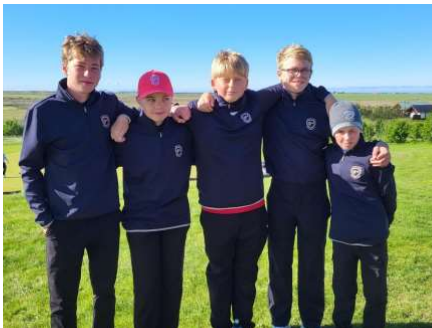
Drengjasveit GM U14 | 8. sæti í Íslandsmóti golfklúbba 2024