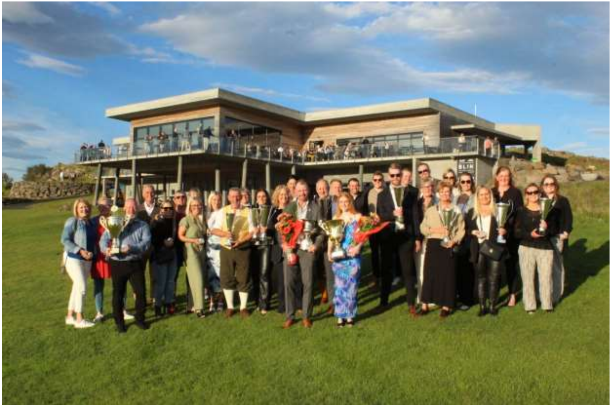
Verðlaunahafar í Meistaramóti GM 2024