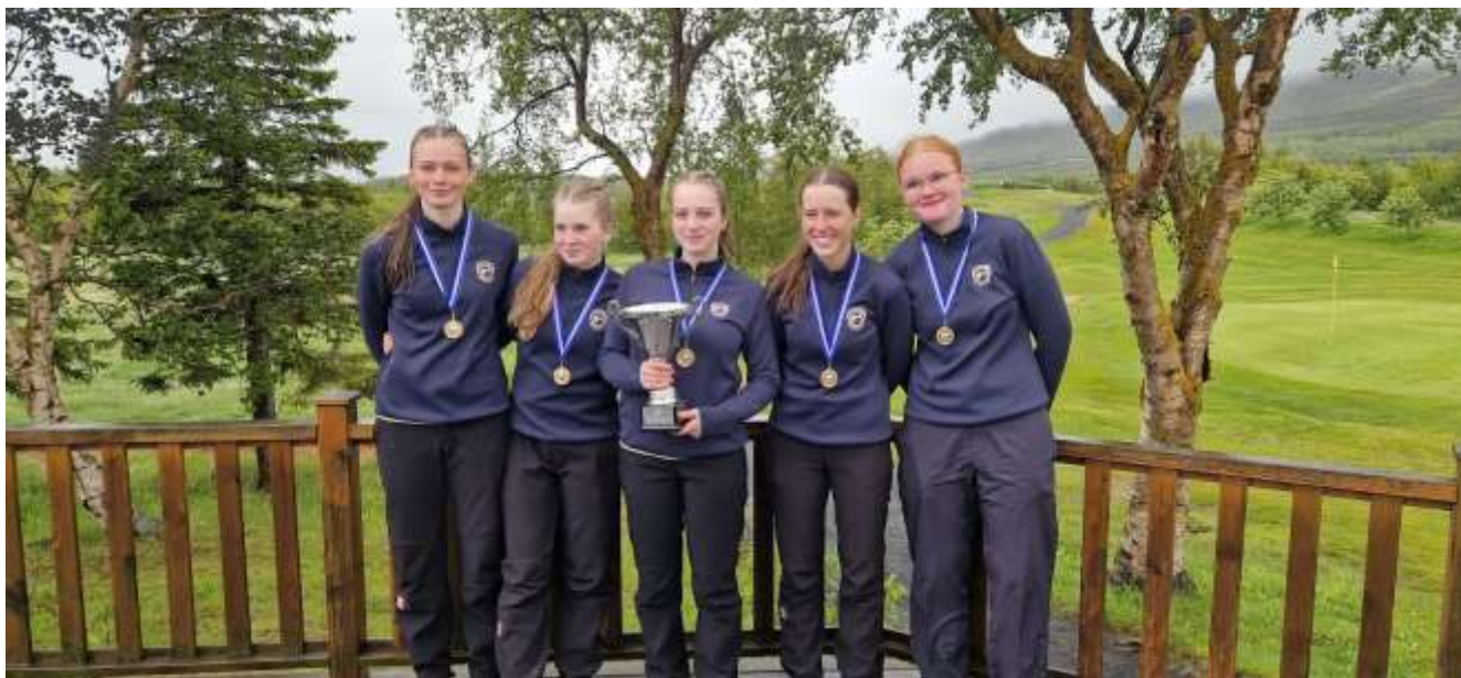
Stúlknasveit GM, Íslandsmeistarar golfklúbba í flokki 18 ára og yngri stúlkna