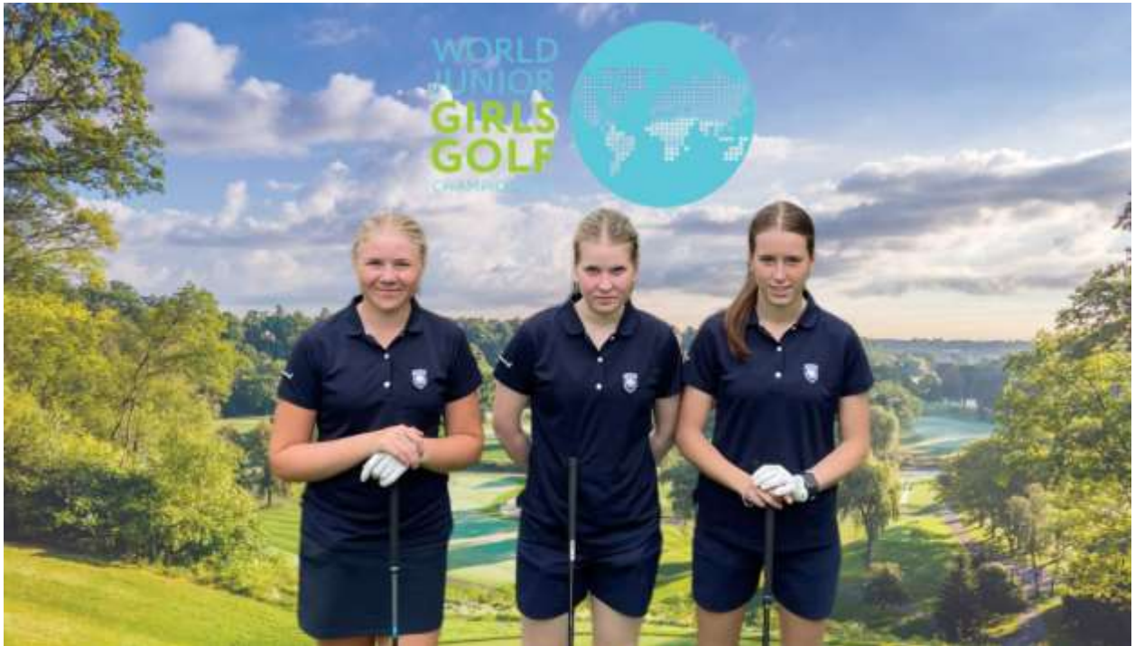
Stúlknalandslið Íslands á HM í annað sinn

Keppnisfyrirkomulagið er högguleikur þar sem leiknar voru 72 holur, 18 holur á dag. Tvö bestu skörin í hverri umferð töldu í liðakeppninni en einnig er keppt í einstaklingskeppni.