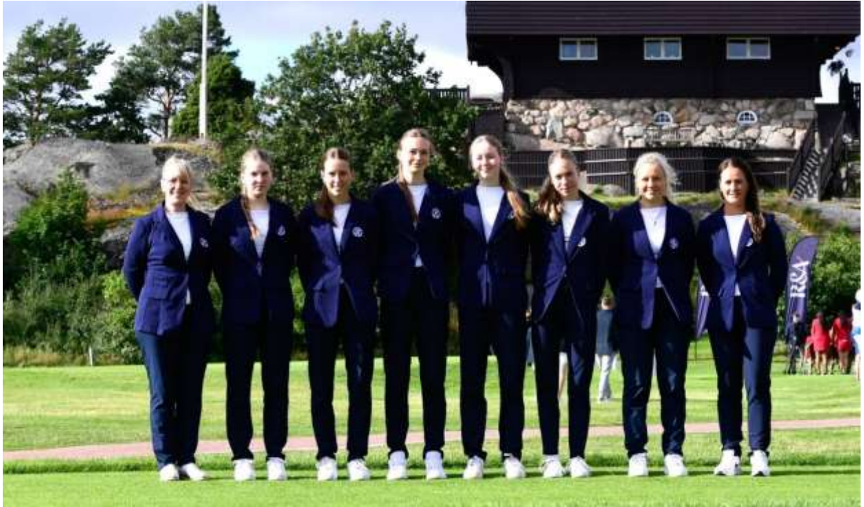
Stúlknalandslið Íslands 2024 skipað af 3 stúlkum úr GM

Leikinn var tveggja daga höggleikur og þriggja daga holukeppni í mótinu. Í höggleiknum endaði lið Íslands í 17. sæti af 19 liðum. Eftir holukeppnisleikina og sigur á móti Eistlandi var lokaniðurstaða íslenska landsliðsins 17. sæti.