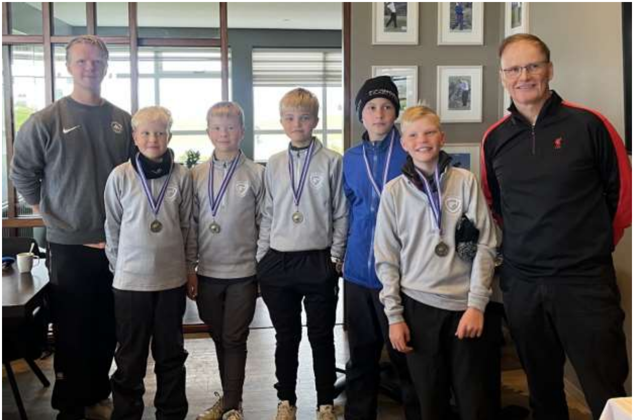
Drengjalið GM endaði í 3. sæti í hvítu deildinni

Markmið mótsins er að skapa liðsheild og stemmingu á meðal þátttakenda og var gaman að fylgjast með liðsheildinni og samheldninni hjá okkar ungu iðkendum.