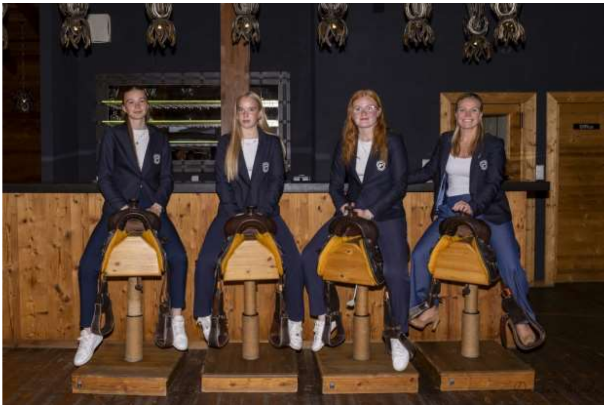
Kvinnalið GM á Evrópumóti golfklúbba í Slóvakíu

Íslandsmeistaralið Golfklúbbs Mosfellsbæjar lék á Evrópumóti golfklúbba í kvennaflokki og enduðu þær í 10. sæti. Mótið fór fram á Welten vellinum í Slóvakíu.