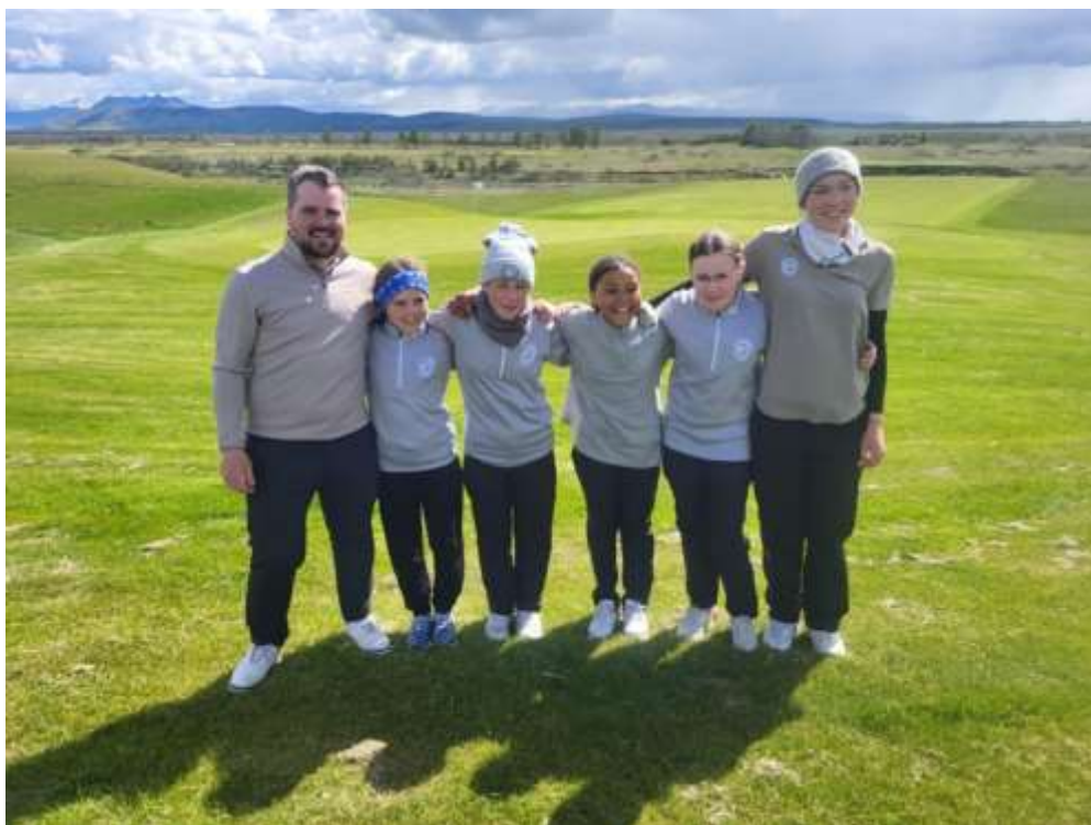
Stúlknasveit GM U14 | 2. sæti í Íslandsmóti golfklúbba 2024