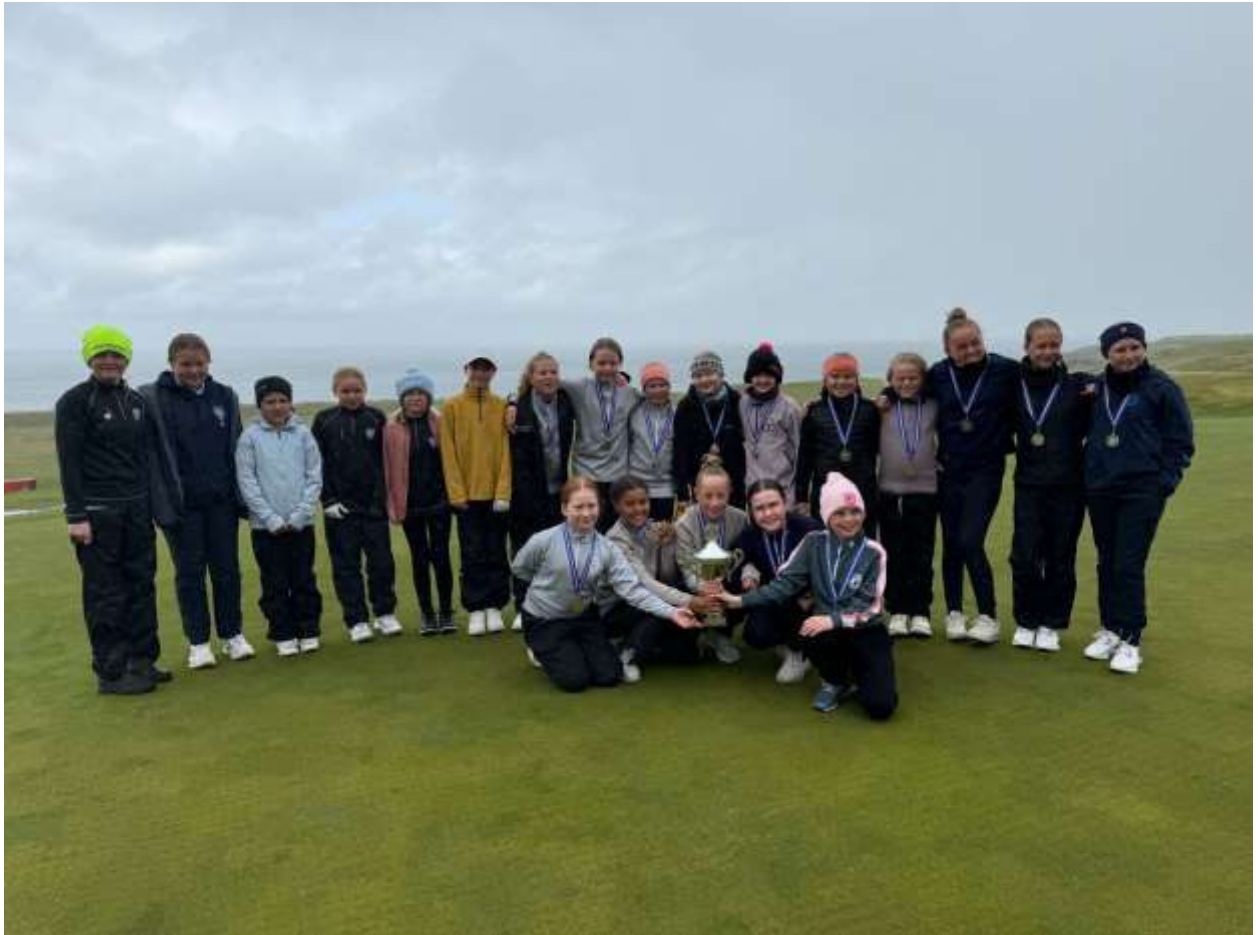
Blandað lið GM enduðu í 4. sæti í rauðu deildinni