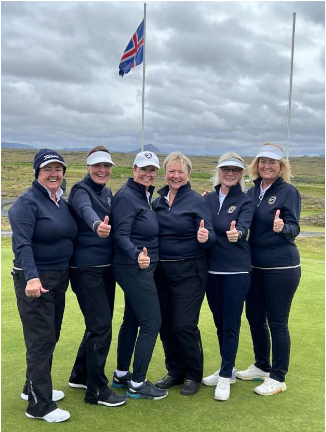
Kvinnasveit GM 65+ 2024

Íslandsmót golfklúbba 65+ hjá konunum fór fram á Golfklúbbi Vatnsleysustrandar í sumar og var lið GM skipað eftirfarandi: