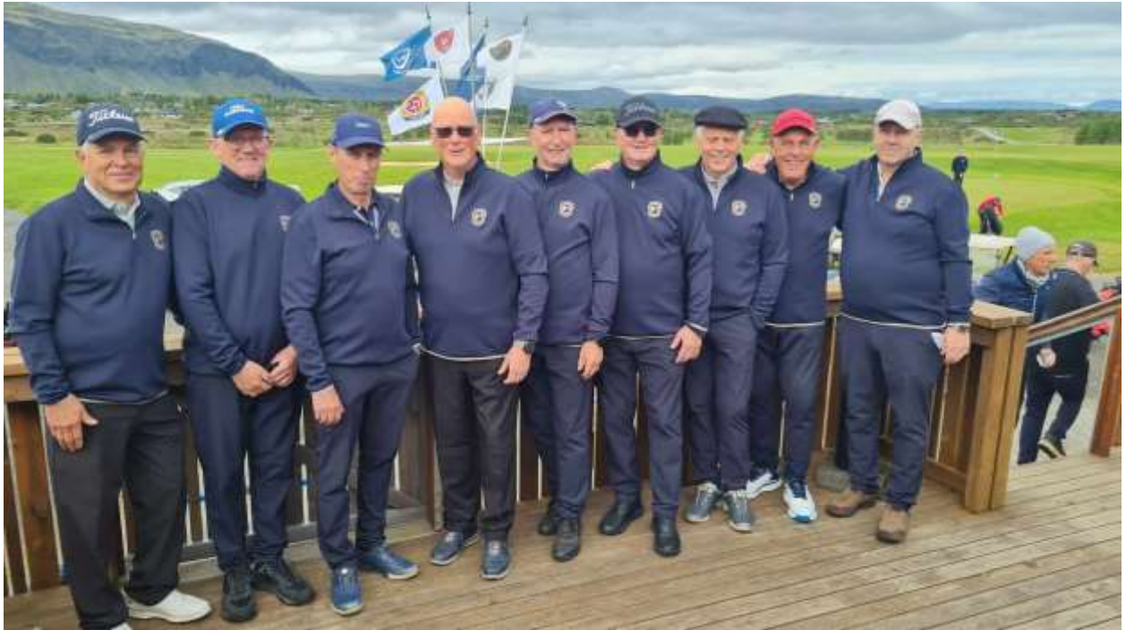
Karlasveit GM 65+ 2024

Íslandsmót golfklúbba 65+ hjá körlunum fór fram í Öndverðarnesi í sumar og var lið GM skipað eftirfarandi: