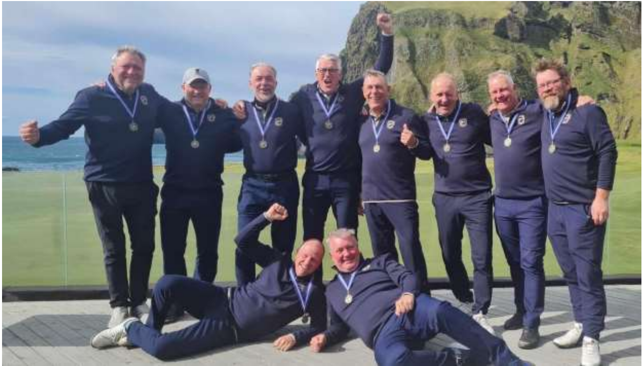
Karlasveit GM 50 ára og eldri | 3. sæti á Íslandsmóti golfklúbba í 2. deild 2024