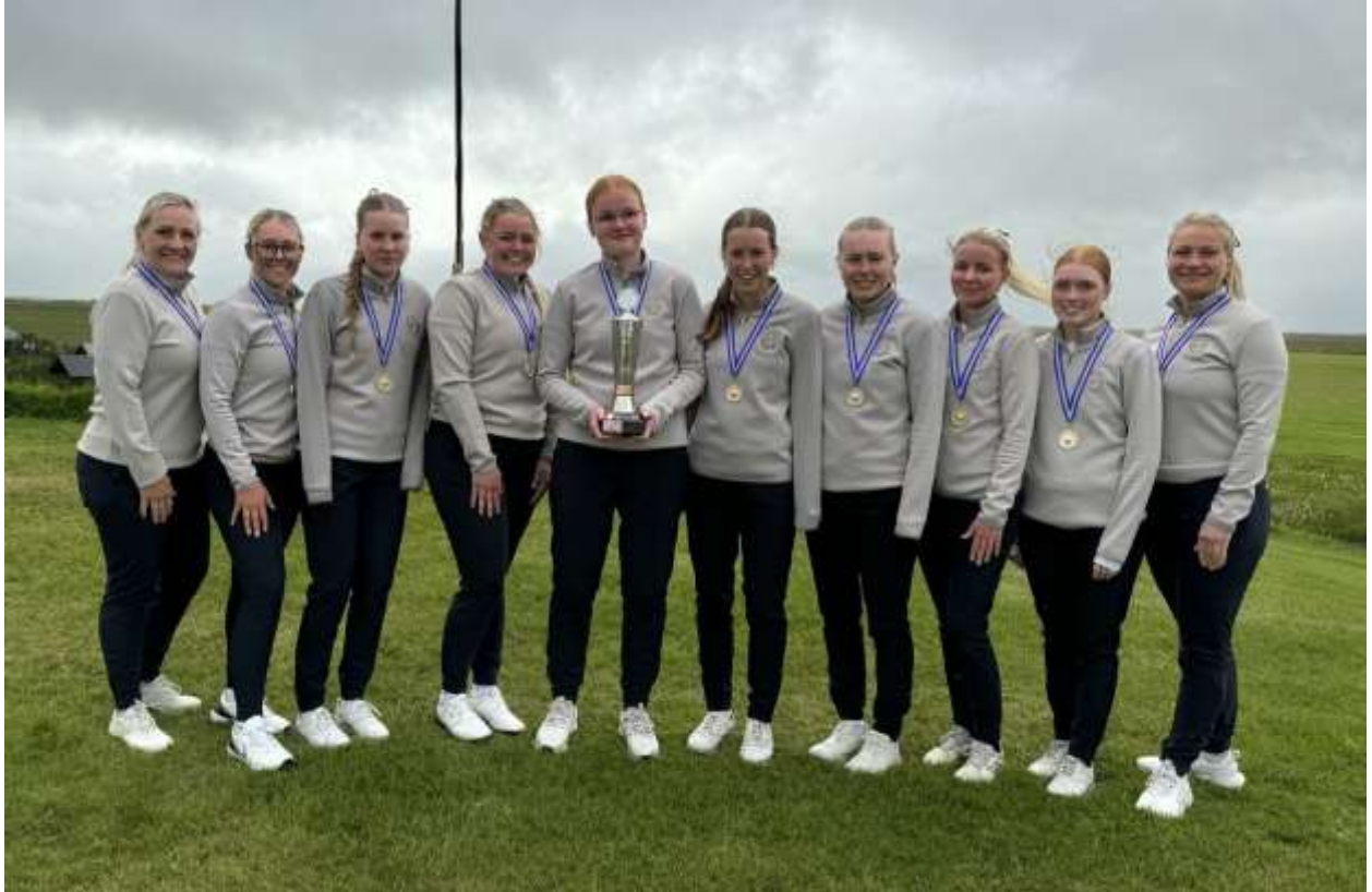
Kvinnasveit GM | Íslandsmeistar golfklúbba 2024

Íþróttastarf Golfklúbbs Mosfellsbæjar hélt áfram að blómstra 2024. Fjölgun var hjá yngstu æfingahópunum eftir vel heppnuð golf- og leikjanámskeið barna í sumar. Alls voru 174 iðkendur sem sóttu golf- og leikjanámskeið hjá GM en haldin voru 7 námskeið. Miklar breytingar voru á uppbyggingu mótaraðanna af hálfu GSÍ og var iðkendum skipt í Golf14 (14 ára og yngri), Unglingamótaröðina (15-18 ára) og Stigamótaröðina (forgjafalægstu komast inn í mótin).