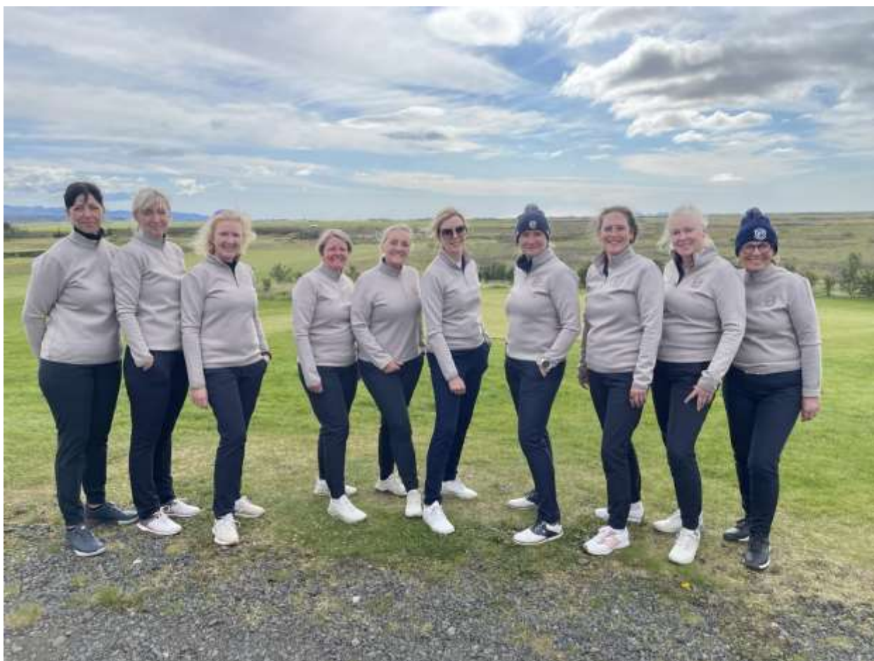
Kvennasveit GM 50 ára og eldri | 8. sæti á Íslandsmóti golfklúbba í 1. deild 2024