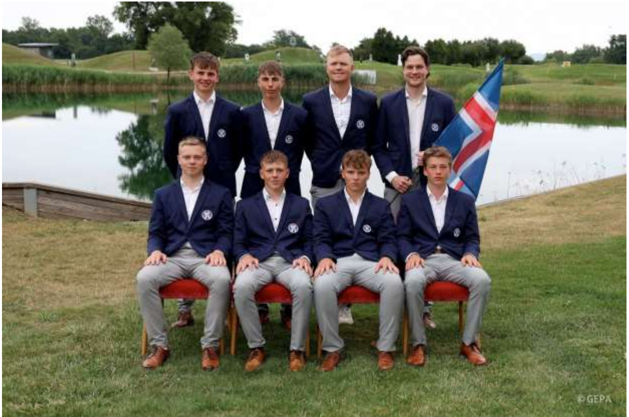
Drengjalandslið Íslands 2024

Leikinn var tveggja daga höggleikur og þriggja daga holukeppni í mótinu. Í höggleiknum endaði lið Íslands í 14. sæti af 16 liðum. Eftir holukeppnisleikina og sigur á móti Spáni var lokaniðurstaða íslenska landsliðsins 15. sæti.