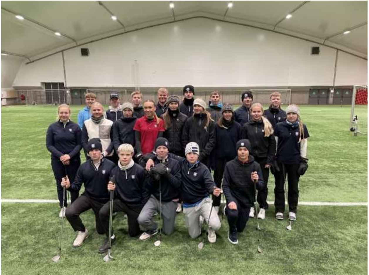
Landsliðshópurinn æfði í Fellinu í Varmá í fyrstu landsliðshelgi vetrarins

Á haustmánuðum var nú valið landsliðshópur GSÍ fyrir keppnisárið 2025. GM á 6 kylfinga af þeim 29 sem eru í landsliðshóp GSÍ. Töluverðar breytingar voru á hópnum en elsti kylfingur hópsins er 24 ára og einungis eru 6 kylfingar í hópnum eldri en 18 ára.